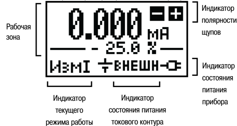
Рисунок 2 – Экран прибора

Внешний вид экрана прибора представлен на рисунке 2 .